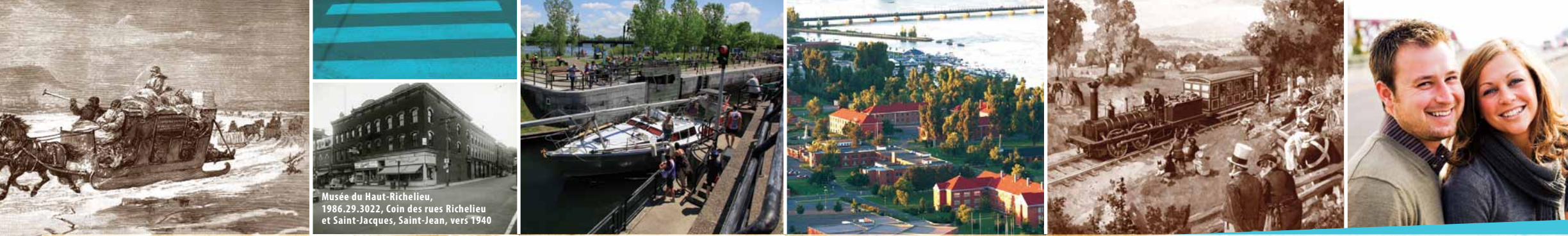
Musée du Haut-Richelieu, 1986.29.3022, Coin des rues Richelieu et Saint-Jacques, Saint-Jean, vers 1940